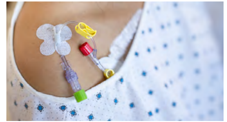
Fixação secundária de cateteres

Confie na ciência e no design dos Fixadores de Tubos e Sondas 3M™ para fixar os tubos, cateteres e drenos de seus pacientes.