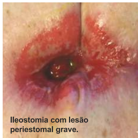
Ileostomia com lesão periestomal grave.

Eliminar a necessidade de morosas técnicas de formação de crostas.