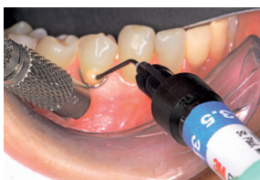
Aanbrengen van Flowable