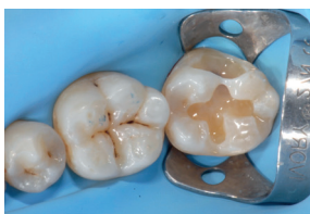
Aanbrengen van Flowable